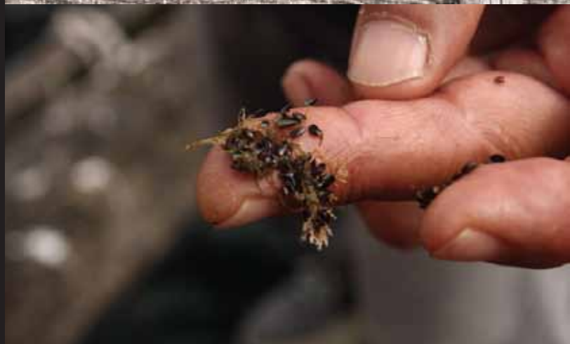
FOTO: Detalle de la cría del mejillón