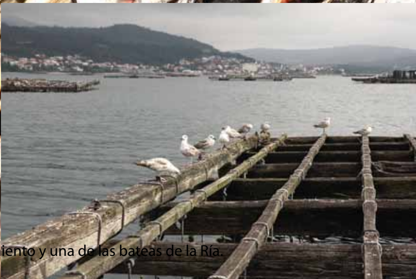
FOTO: Una empacadora de mejillón a pleno funcionamiento y una de las bateas de la Ría.