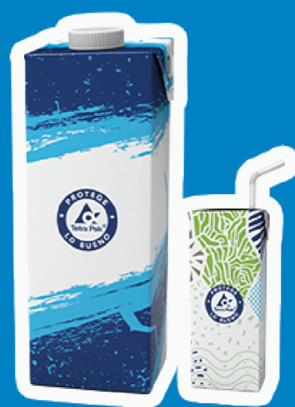
Envases de Tetra Pak®